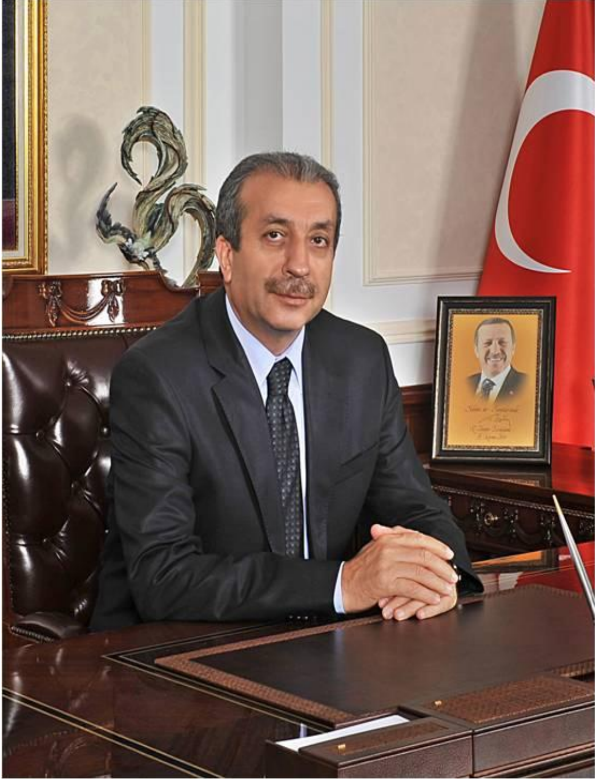
Mehmet Mehdi EKER Gıda Tarım ve Hayvancılık Bakanı