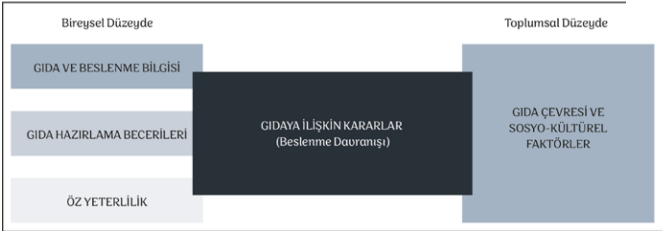
Şekil 4: Türkiye Gıda Okuryazarlığı Eylem Planı Bileşenleri (Kaynak: Ontario, Kanada LDCP Sağlıklı Beslenme Ekibi tarafından oluşturulan "Gıda Okuryazarlığı Çerçevesi" (2018) temel alınmıştır.)